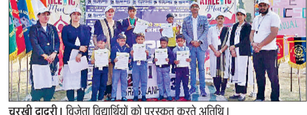
चरखी दादरी। विजेता विद्यार्थियों को पुरस्कृत करते अतिथि।

कान्हड़ा स्थित श्रीराम पब्लिक स्कूल में दो दिवसीय खेल महोत्सव के दूसरे दिन श्रो बॉल, बैडमिंटन व रस्सा क सी खेल प्रतियोगिता आदि हुईं सम्पन्न प्रतियोगिताएं हुईं, जिसमें