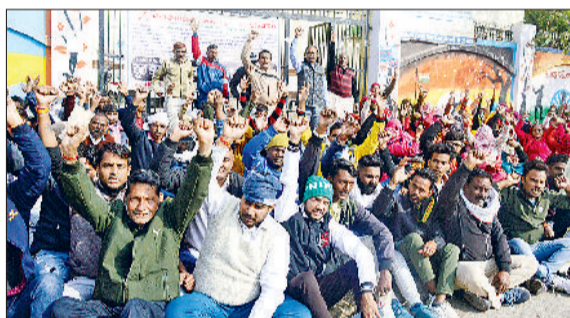
मिवानी। नगर परिषद कार्यालय के बाहर नारेबाजी करते कर्मचारी तथा खाली पड़ा अधिकारी का कार्यालय।