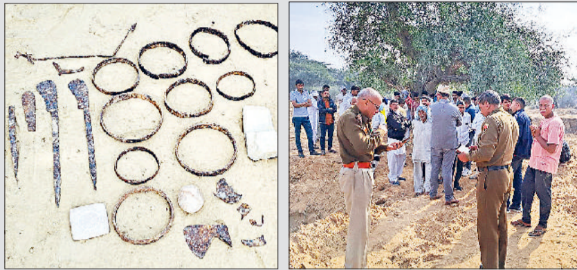
बाढ़ड़ा। कुंड खुदाई के दौरान मिले लोहे व पत्थर के प्राचीन औजार तथा मौके पर पहुंची पुलिस टीम व लोगों की भीड़।

जेसीबी से खुदाई के दौरान 10 से 15 फिट नीचे कुछ वस्तुएं दिखाई दीं। जिससे बाद जेसीबी ऑपरेटर डर गया और उसने खुदाई बंद कर ग्रामीणों को इसकी सूचना दी। जिसके बाद ग्रामीण वहां एकत्रित हो गए और खुदाई से निकली वस्तुओं को एकत्रित किया गया। इन वस्तुओं में लोहे की कुल्हाड़ी के अलावा नुकीले औजार, लोहे का त्रिशूल, लोहे के रिंग, दीपक शामिल हैं। इसके अलावा पत्थर के गोलाकार, आयताकार व वगैरह टुकड़े शामिल हैं। इन औजारों को देखकर इतना तो स्पष्ट है कि ये काफी प्राचीन हैं लेकिन त्रिशूल व दीपक के साथ नुकीले औजार होने पर ग्रामीणों को कुछ समझ नहीं आ रहा है कि आखिर मामला क्या है।