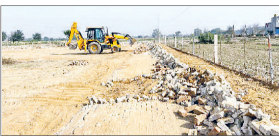
मिवानी। अवैध निर्माण गिराती जेसीबी मशीन।

नगर योजनाकार विभाग ने मिवानी-दादरी बाइपास रोड पर एव मिवानी-लोहाड़ में अवैध कॉलोनी से निर्माण हटाने का अभियान चलाया। इस अभियान के दौरान जेसीबी मशीन से डीमार्केशन, इलेक्ट्रीक पोल एवं कच्चे रास्तों के नेटवर्क को तोड़ा गया। जिला नगर योजनाकार नीलम शर्मा ने कहा कि अवैध निर्माण हटाओ अभियान के तहत मिवानी शहरी क्षेत्र मीजा कंटेंट में मिवानी-दादरी बाइपास रोड पर