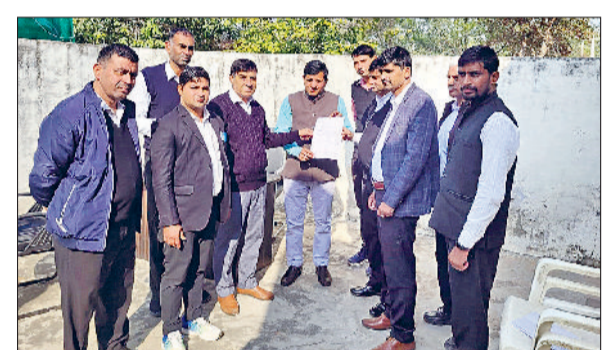
बाढ़ड़ा। एसडीएम को ज्ञापन सौंपते अधिकारता।

पुराने कलेक्टर रेटों में बढ़ोतरी न करने की मांग रखी