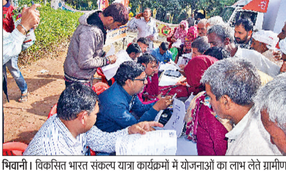
भिवानी। विकसित भारत संकल्प यात्रा कार्यक्रमों में योजनाओं का लाभ लेते ग्रामीण।

बुधवार को गांव धनाना, बडेसरा, भाखड़ा-हरिपुर व दाणी ब्राह्मणधाम में विकसित भारत संकल्प यात्रा के तहत कार्यक्रम आयोजित हुए। कार्यक्रमों में बड़ी संख्या में महिलाएं उज्वला योजना के तहत गैस कनेक्शन लेने के लिए पहुंचीं। गैस एजेंसी संचालकों ने मौके पर ही दस्तावेज पूरे कर आवेदन लिए, जिससे महिलाओं के चेहरे पर खुशी की रौनक नजर आई। वहीं कार्यक्रमों में स्वास्थ्य की जांच